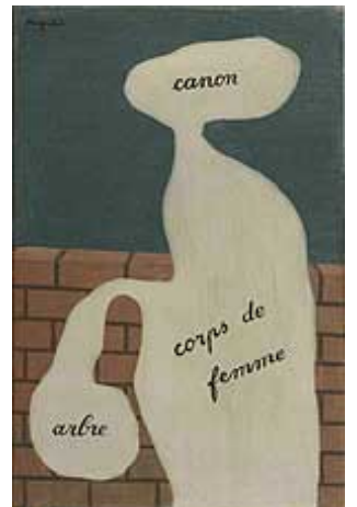
L'usage de la parole, 1927-1929

7/ Combinez un objet avec le nom d'un autre